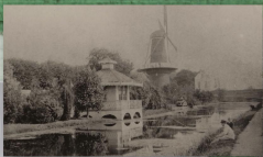
Een niet meer bestaand theehuis langs de Oude Singel