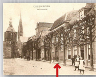
Een oude foto met de drie Barbara-kerken in Culemborg. De Oud-Katholieke kerk wordt aangegeven door de rode pijl.