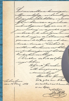
Laatste vel van Alegonda's brief (1864) aan de burgemeester van Gorinchem

kelder. Ik was de laatste die de kelder wilde ingaan. Plots was er een enorme explosie vlakbij ons huis aan de Kortendijk.” “Hier in Schoonhoven?” “Nee, in Gorkum is ook een Kortendijk... en een Langendijk, waar de broer van mijnheer woonde. Ik wist niets meer na die explosie. Ze vonden mij onder het puin, want bovenop het puin lag mijn mutsje, dat hier aan de muur hangt. Daar heb ik mijn leven aan te danken!”